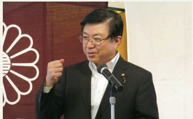
自民党大分県連リーダーシッププログラムで講演