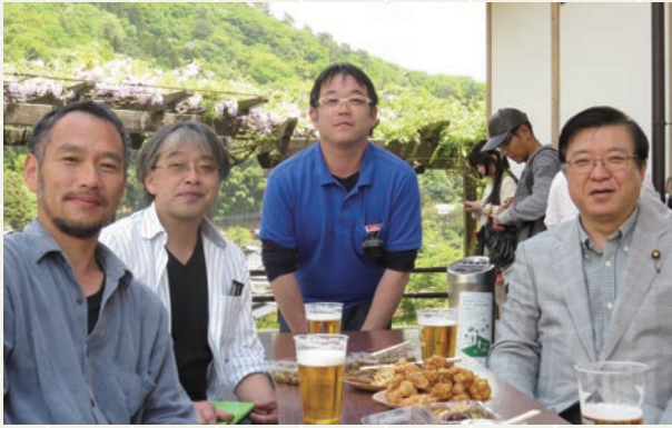
小鹿田焼窯元若手経営者の皆さんと