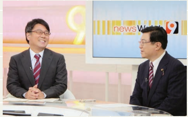
NHK「ニュースウォッチ9」に出演