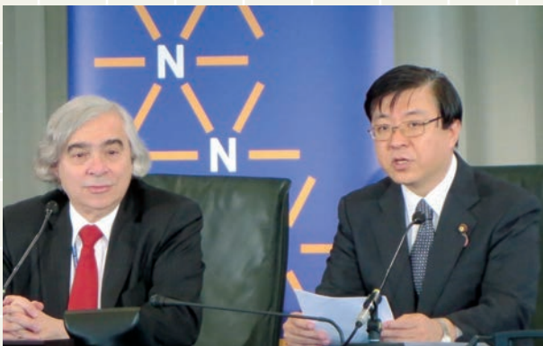
オランダの核安全サミットで米国エネルギー長官と