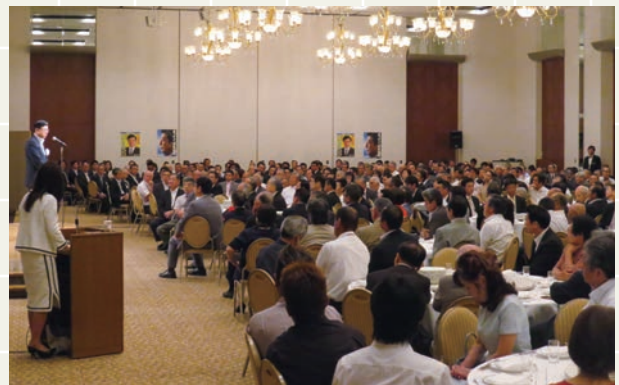
大分市での国政報告会