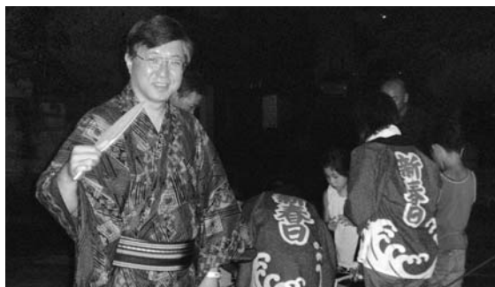
新春日町供養盆踊り大会で

ホームページで、活動記録を御覧いただけます。 http://www17.ocn.ne.jp/~isozaki/