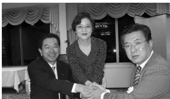
支援者の皆さんと