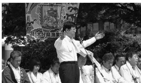
漁業経営危機突破漁民大会で