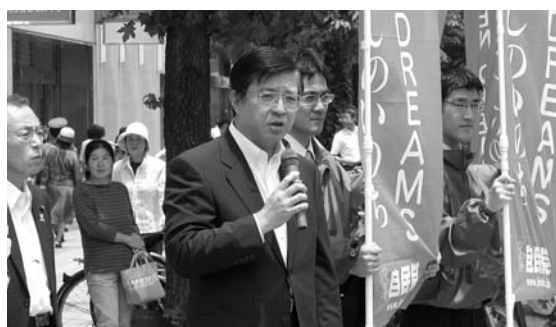
サミットキャンペーン