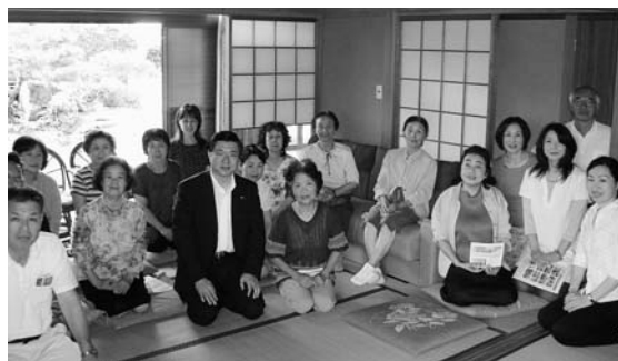
佐賀関地区ミニ集会