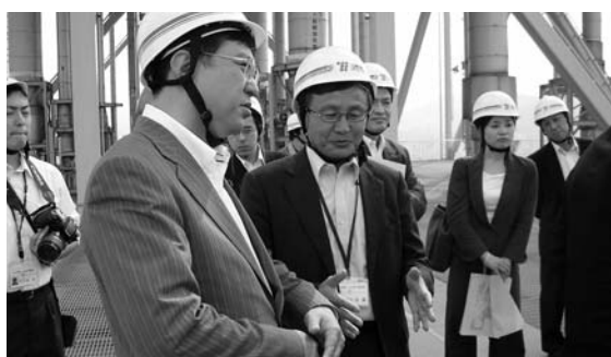
九電苅田発電所の屋上で